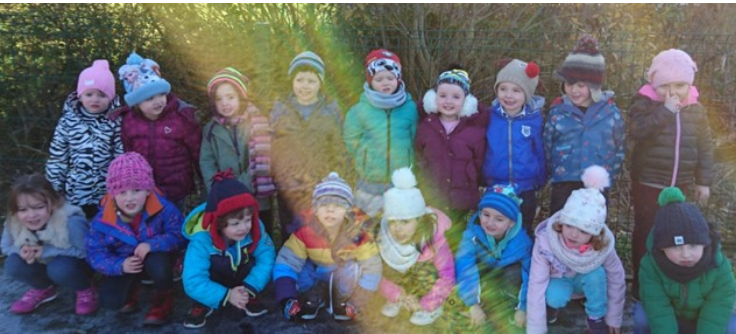
Naíonra Bhaile Bhuirne, Co. Chorcaigh