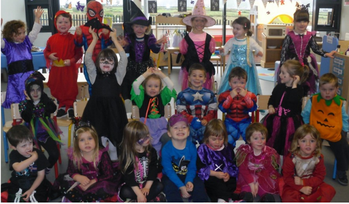
Naíonra Bhaile an Fheirtéaraigh, Co. Chiarraí