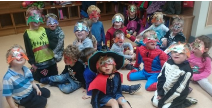
Naíonra Bhréanainn, Co. Chiarraí