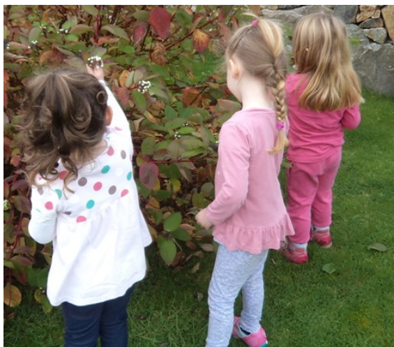
Ag piocadh duilleoga