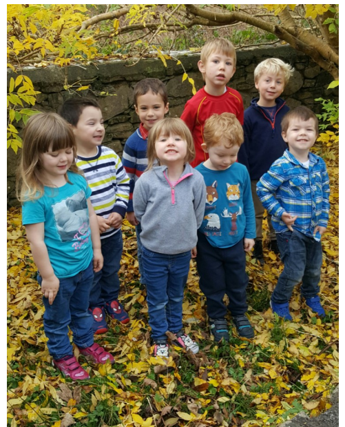
Naíonra Cheann Trá, Co. Chiarraí ag baint sult as an bhFómhar.