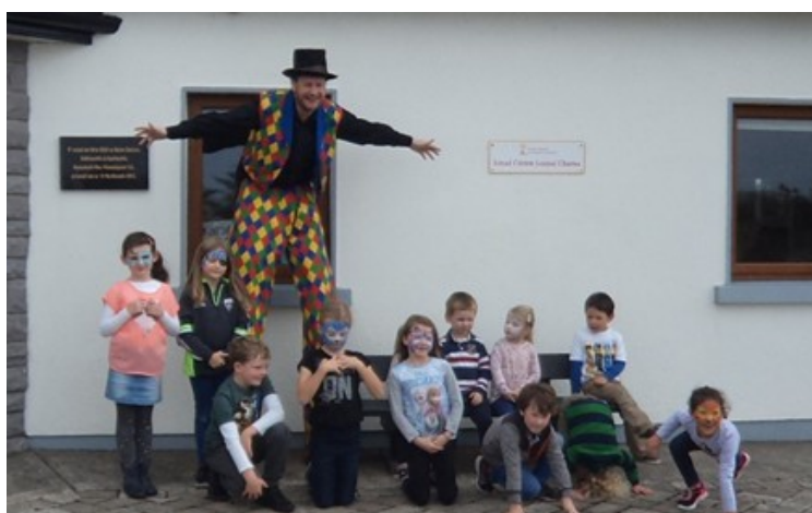
Spórt agus spraoi