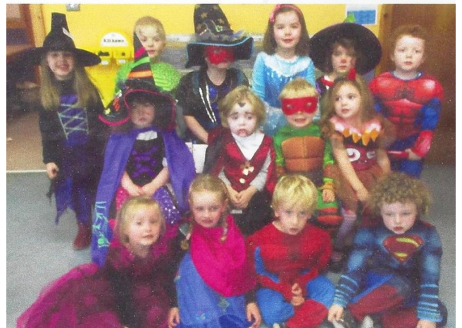
Naíonra Chill na Martra, Co. Chorcaigh