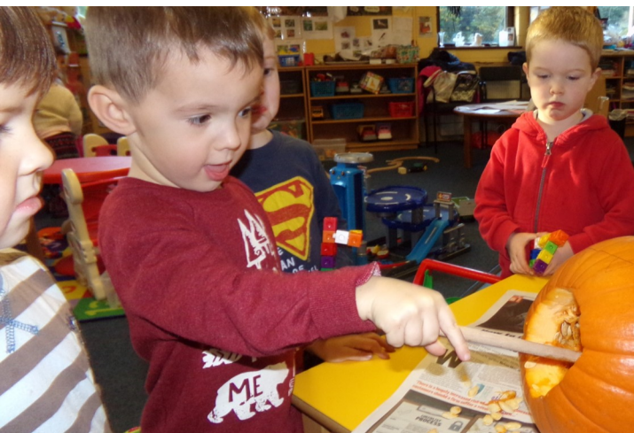
Naíonra na Rinne, Co Phort Láirge ag fáil a gcuid puimecíní réidh d'óiche Shamhna