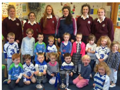
Páistí Naíonra na Rinne ag ceiliúradh le himreoirí Chumann Camógaíochta na Rinne leis an gCorn Idirmheánach na hÉireann, Corn Jack McGrath agus Corn Idirmheánach an Chontae, Corn Mamie O'Meara.