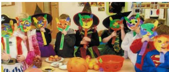
Naíonra Mhic Dara, An Cheathrú Rua ag ceiliúradh Oíche Shamhna!