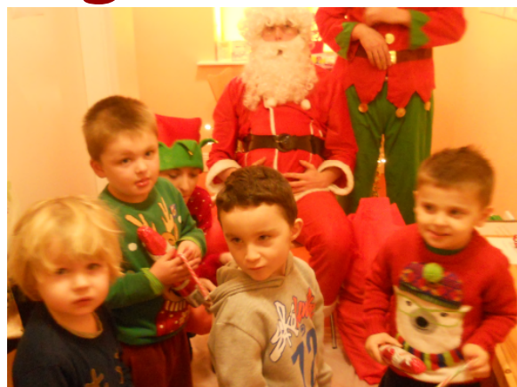
Naíolann Ráth Chairn, Co. na Mí