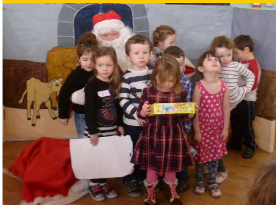
Naíonra Ros an Mhíl, Co. na Gaillimhe