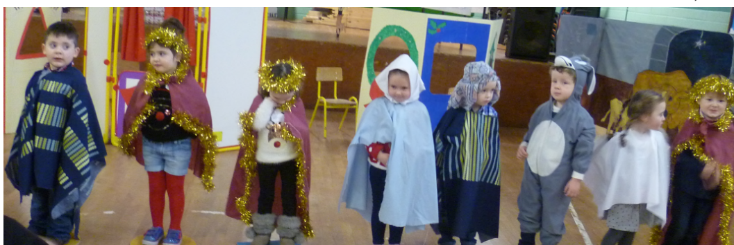
Páistí as Naíonra Ros an Mhíl, Co. na Gaillimhe ag déanamh dráma Nollag.