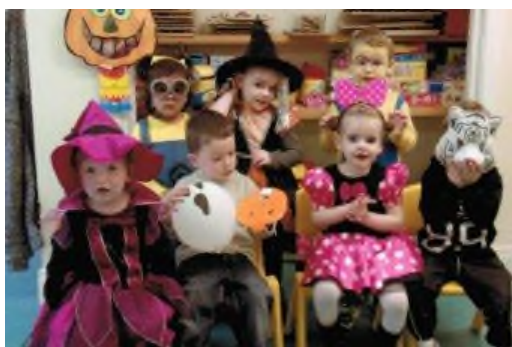
Naíonra na Crannóige Co. Dhún na nGall